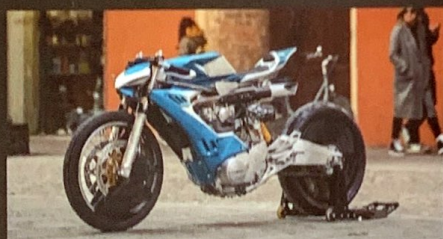
YAMAHA XS 650 - BY SC MOTORCYCLES